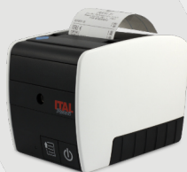
Stampante telematica PRX