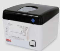
Stampante telematica PR2