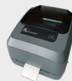
Stampante per etichette e frontali