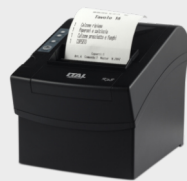
Stampante non fiscale